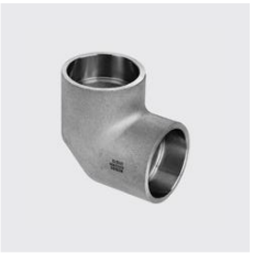
I-222 Coude à emboîter Type de matériau: acier inoxydable, Matériau: 1.4404, Ø extérieur mm : 48.3, ID unique: I222 48.3, SKU 17177281