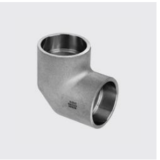
I-222 Coude à emboîter ID unique: I222 42.4, Type de matériau: acier inoxydable, Matériau: 1.4404, Ø extérieur mm : 42.4, SKU 17177280