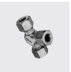
R-1324 Raccord Té à bague de sertissage Type de matériau: acier inoxydable, pour tube mm: 21,3, Matériau: 1.4404, ID unique: R132421.3, SKU 17117270