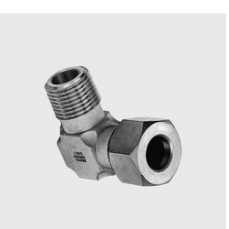
R-1325 Raccord coudé à bague de sertissage filetage mâle d'un côté Filetage POUCE : 1/4, ID unique: R1325 12x1/4, Type de matériau: acier inoxydable, Matériau: 1.4404, pour tube mm: 12, SKU 17118190