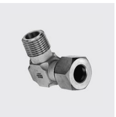
R-1325 Raccord coudé à bague de sertissage filetage mâle d'un côté Filetage POUCE : 1/4, ID unique: R1325 6x1/4, Type de matériau: acier inoxydable, Matériau: 1.4404, pour tube mm: 6, SKU 17118160