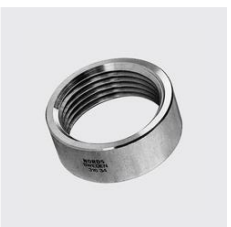
R-216 Runde Mutter Unique-Id: R216 2 1/2, Materialart: Edelstahl rost- beständig, Gewinde ZOLL: 2 1/2, Werkstoff: 1.4404, Länge Total mm: 23, SKU 17150250