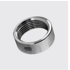
R-216 Runde Mutter Materialart: Edelstahl rostbeständig, Werkstoff: 1.4404, Gewinde ZOLL: 3, Länge Total mm: 25, Unique-Id: R216 3, SKU 17150260