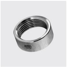
R-216 Runde Mutter Unique-Id: R216 3/4, Materialart: Edelstahl rostbeständig, Werkstoff: 1.4404, Gewinde ZOLL: 3/4, Länge Total mm: 13, SKU 17150190