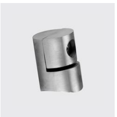
GN-6514 Blechhalter, geschliffen Werkstoff: 316, Unique-Id: GN6514 flach, für Rohr mm: flach/plat, Materialart: Edelstahl rostbeständig, SKU 188734600