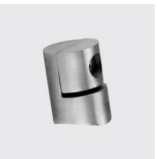
GN-6514 Blechhalter, geschliffen Werkstoff: 316, Unique-Id: GN6514 48.3, Materialart: Edelstahl rostbeständig, für Rohr mm: 48.3, SKU 188734590