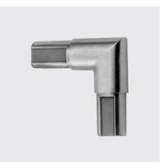
GN-6504 Echbogen für Einfassprofil, geschliffen Materialart: Edelstahl rostbeständig, Dicke mm: 1.25, Unique-Id: GN6504 20X1.25, Werkstoff: 316, Aussen-Ø mm: 20, SKU 188735020