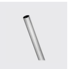
GN-6502 Einfassprofil, geschliffen Aussen-Ø mm: 20, Wandstärke mm: 1.25, Materialart: Edelstahl rostbeständig, Unique-Id: GN6502 20X1.25, für Blechstärke mm: 1.5 - 2.0, Werkstoff: 304, SKU 124401302