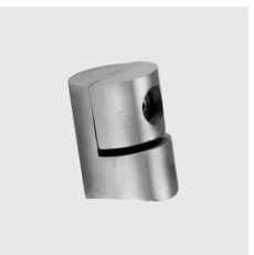
GN-6514 Blechhalter, geschliffen Werkstoff: 316, Unique-Id: GN6514 42.4, Materialart: Edelstahl rostbeständig, für Rohr mm: 42.4, SKU 188734580