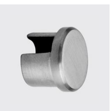
GN-6512 Endkappe rund für Einfassprofil, geschliffen Unique-Id: GN6512 20X1.25, Werkstoff: 304, Aussen-Ø mm: 20, Dicke mm: 1.25, Materialart: Edelstahl rostbeständig, SKU 188735010