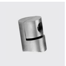
GN-6514 Blechhalter, geschliffen für Rohr mm: 33.7, Werkstoff: 316, Materialart: Edelstahl rostbeständig, Unique-Id: GN6514 33.7, SKU 188734570