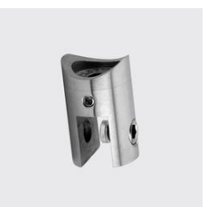
GN-6524 Plattenhalter, geschliffen Werkstoff: 304, für Rohr mm: 42.4, Materialart: Edelstahl rostbeständig, Unique-Id: GN6524 42.4, SKU 188734655