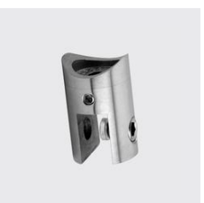
GN-6524 Plattenhalter, geschliffen Werkstoff: 304, Unique-Id: GN6524 flach, für Rohr mm: flach/plat, Materialart: Edelstahl rostbeständig, SKU 188734665