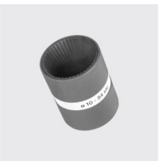
P-8210 Ebavureur de tube ID unique: P8210 10-54, pour tube mm: 10-54, SKU 145502610