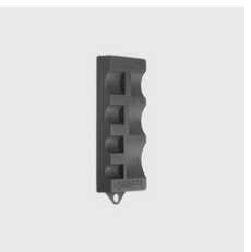
P-822 Réglette de marquage de la profondeur d'emboîtement pour tube mm: 15-54, ID unique: P822 Lehne, SKU 14522001