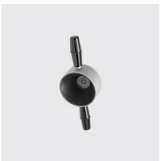
P-8215 Ebavureur de tube pour tube mm: 63 - 110, ID unique: P8215 76-1-108, SKU 145502710