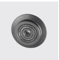
P-8111 Molette pour coupe-tubes ID unique: P8111 6-70, pour tube mm: 6-70, SKU 145502310