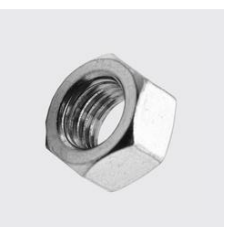
K-240 Sechskantmutter mit UNC-Gewinde Gewinde: 3/4, Materialart: Edelstahl rostbeständig, Werkstoff: A4, Unique-Id: K240+3/4, SKU 5218460