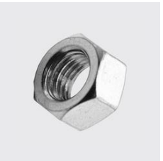
K-240 Sechskantmutter mit UNC-Gewinde Unique-Id: K240+5/16, Gewinde: 5/16, Materialart: Edel- stahl rostbeständig, Werkstoff: A4, SKU 5218420